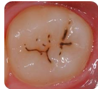
Foto: verfärbte Fissuren

Wenn sich unversiegelte Fissuren dunkel verfärben , wird der Zahnarzt oder die Zahnärztin entscheiden, ob die Fissur